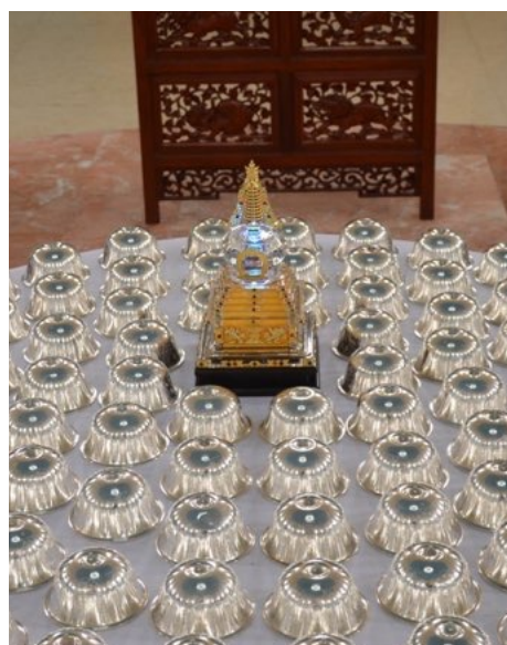
Рингсел Будды Шакьямуни

В 25-й лунный день первого зимнего месяца (12 декабря 2012 года), день Праздника светильников, посвященного великому Чже Цонкапе, в наш дацан были доставлены священные реликвии (санскр. śaṅgā, шарира; тиб. ring bsrel, рингсел) Будды Шакьямуни. Силой благословения досточтимого Ело Ринпоче священные реликвии Будды Шакьямуни хранятся теперь в нашем дацане.